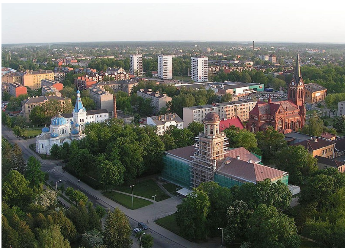
Jelgava (Mitavi) tänapäeval