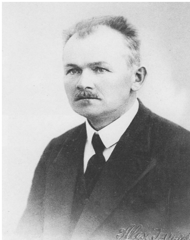
Bernhard Voldemar Schmidt (1879-1935)

Bernhard Schmidt esivanemad hoidsid end elus samal viisil nagu kogu Eesti rannarahvas – põhitoiduseks oli merest püütud kala, sellele lisaks andis lehm piima ja kehvadelt põldudelt sai kartulit. Tavaliselt kasvasid igas peres ka siga ja mõned lambad. Suvel tuli lisaks merelkäimisele veel kibekiiresti lehma- ja lambahein teha.