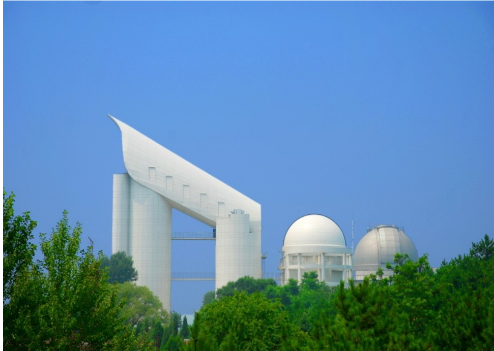
LAMOST teleskoop Hiinas - maailma suurim Schmidt-tüüpi teleskoop